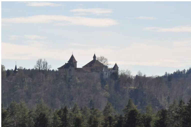
Blick vom Eschenberg auf die Kyburg

Route: Winterthur Sennhof – Eschenberg – Wildpark Bruderhaus - Winterthur